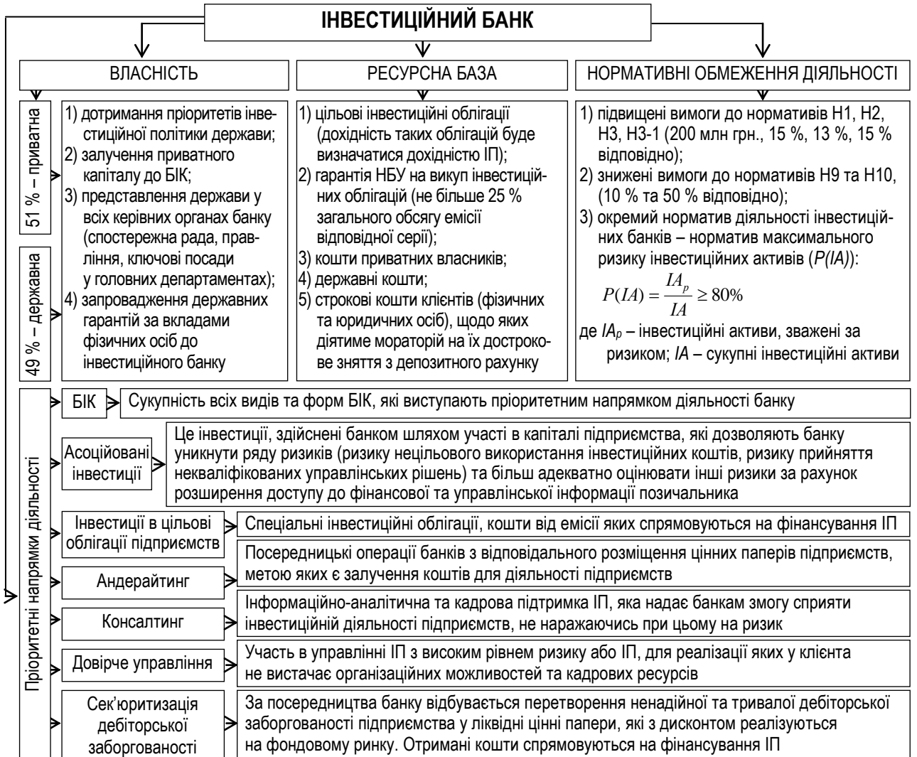
Рисунок 2 – Організаційно-функціональні засади діяльності інвестиційних банків в Україні

облігації. Такий формат функціонування інвестиційного банку відрізняється від попереднього тим, що враховує інтереси приватних власників, держави та підприємств, що сприятиме активізації інвестиційних процесів в економіці України. Обґрунтовано необхідність розробки принципово нового підходу до формування структури власності цих банків, їх ресурсної бази, визначення напрямів діяльності та встановлення Національним банком України економічних нормативів (рис. 2).