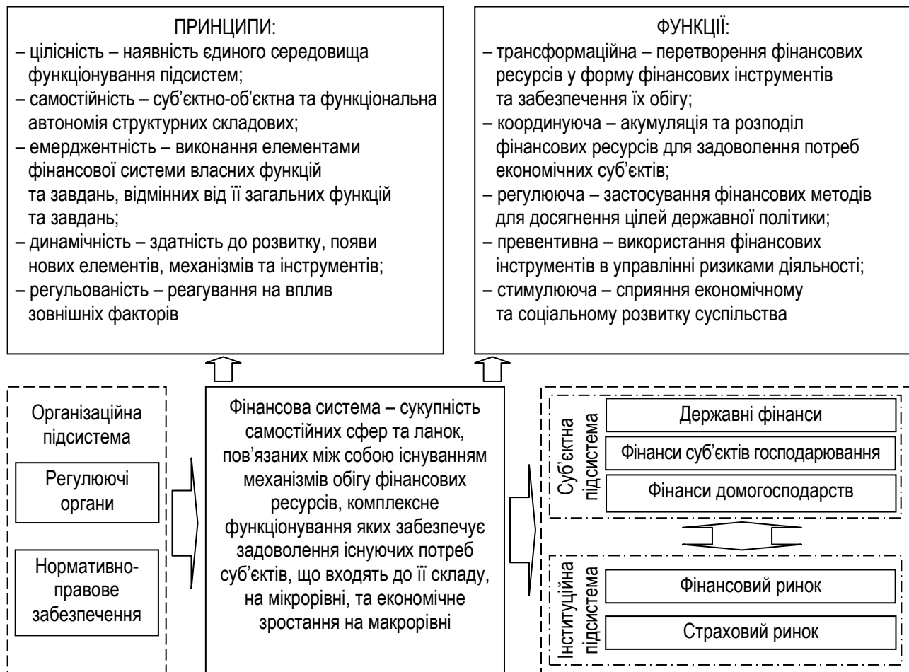
Рисунок 1 – Структурно-функціональна побудова фінансової системи

стійкості окремих інституційних секторів фінансової системи (банківського, страхового, фондового тощо); макрорівневий, що передбачає визначення критеріїв та передумов стійкості фінансової системи в цілому.