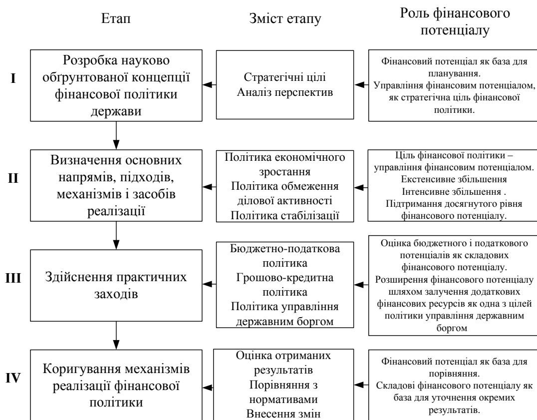
Рисунок 1 – Роль фінансового потенціалу у формуванні фінансової політики

Обгрунтовується, що у досягненні ефективності управління ФПТ важливими є питання, пов'язані з зовнішніми джерелами фінансування, оскільки такі ресурси мають значно меншу вартість залучення, а обсяги залучення – значні.