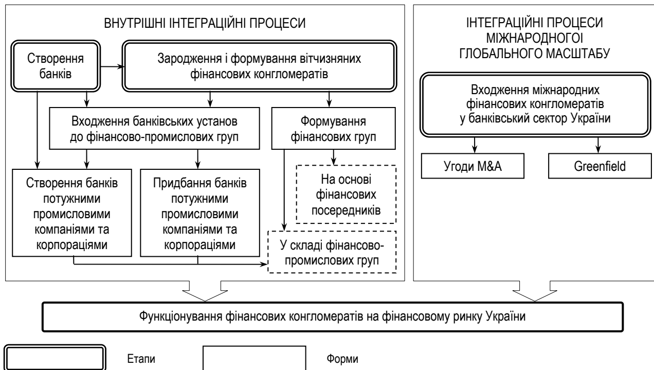
Рис. 3. Організаційні форми банківського бізнесу на різних етапах створення і розвитку фінансових конгломератів в Україні

У результаті проведеного автором ретроспективного аналізу розвитку фінансового ринку України з позицій формування і функціонування інтеграційних утворень запропоновано періодизацію становлення фінансових конгломератів в Україні: перший етап – формування фінансово-промислових груп (1992-1997 рр.); другий – посилення фінансового блоку фінансово-промислових груп (1996-2000 рр.); третій – формування фінансових груп (2001-2007 рр.); четвертий – входження міжнародних фінансових конгломератів на фінансовий ринок України (з 2002 р.); п'ятий – активна діяльність фінансових конгломератів на вітчизняному фінансовому ринку (з 2008 р.). Розроблена періодизація враховує вплив внутрішніх, міжнародних і глобальних інтеграційних процесів, що дозволило обґрунтувати провідну роль банків в активізації формування конвергентно-інтеграційних об'єднань на фінансовому ринку України (рис. 3).