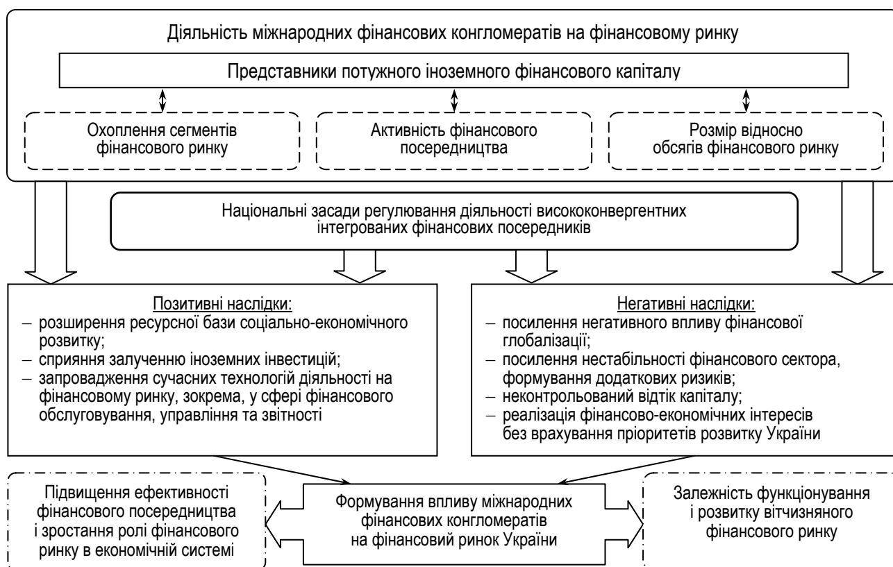
Рис. 4. Механізм впливу міжнародних фінансових конгломератів на фінансовий ринок України

У роботі формалізовано напрями впливу міжнародних фінансових конгломератів на стан фінансового ринку України та систематизовано наслідки їхнього функціонування на вітчизняному фінансовому ринку (рис. 4).