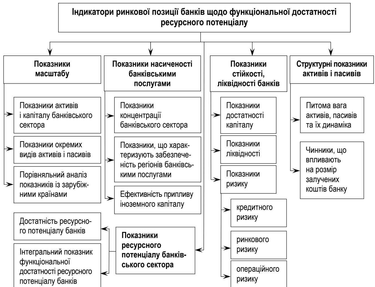
Рис. 2. Індикатори ринкової позиції банків щодо функціональної достатності ресурсного потенціалу

Проведене дослідження дало змогу обґрунтувати необхідність оцінки банків щодо їх ринкової позиції з точки зору функціональної достатності ресурсного потенціалу банку. При цьому ринкова позиція передбачає визначення основних індикаторів, за допомогою яких можна оцінити досягнутий рівень стабільності, ринкової кон'юнктури щодо капіталізації, збалансованості залучених і розміщених ресурсів банку та їх достатності. Відповідно до цього у дисертаційному дослідженні пропонуються індикатори оцінки ринкової позиції банків щодо функціональної достатності ресурсного потенціалу банку (рис. 2).