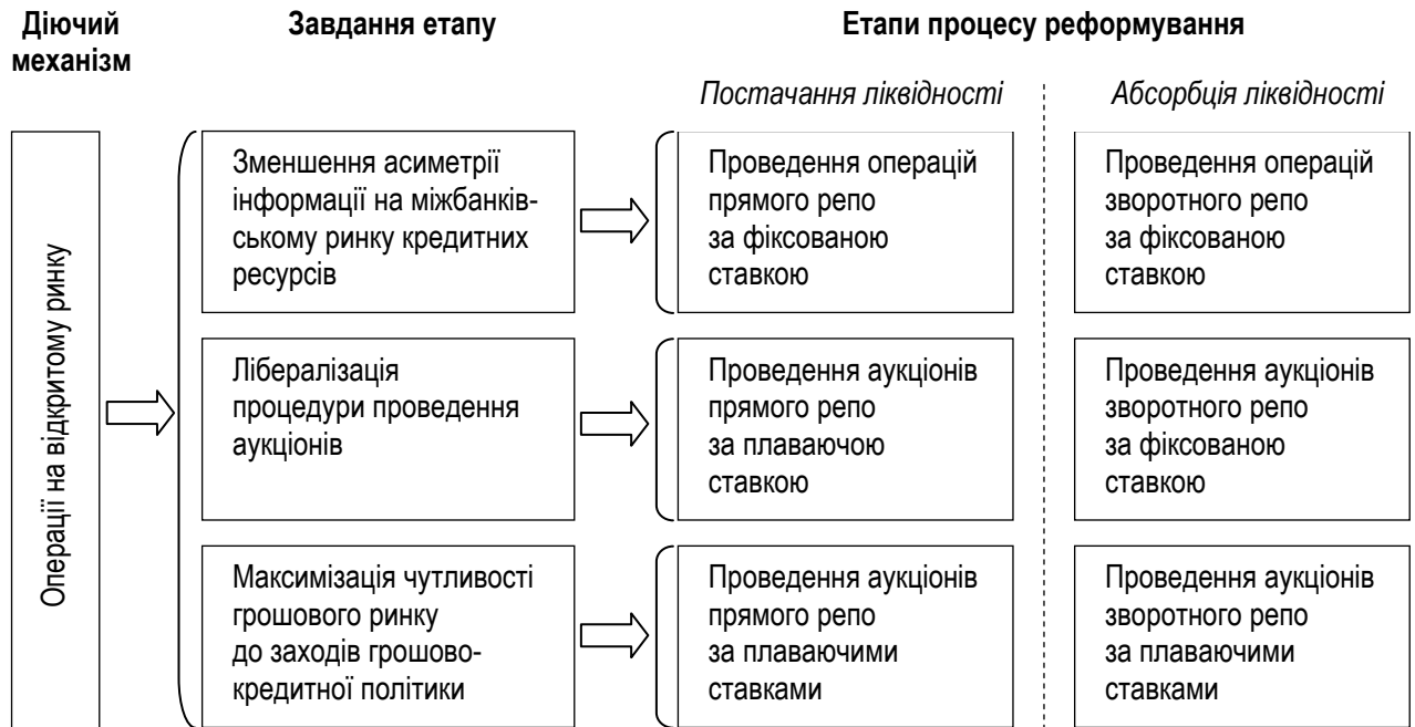
Рис. 3. Основи комунікаційної політики та її процедурні елементи з організації операцій на відкритому ринку в умовах інформаційної асиметричності грошового ринку

У рамках запропонованих автором підходів до реформування параметрів системи обов'язкового резервування робиться наголос на тому, що завданням першого етапу є реструктуризація міжбанківських кредитів за строками на користь однодобових, що може бути досягнуто через зменшення часового лагу між початком періодів нарахування та дотримання резервних вимог (застосування напівлагової системи). Це сприятиме: 1) актуалізації проблеми виконання резервних вимог; 2) збільшенню дисциплінованості комерційних банків; 3) підвищенню залежності банків від рефінансування.