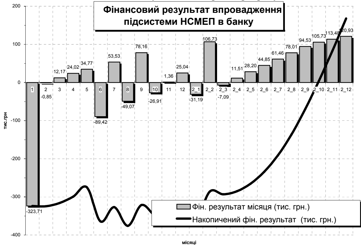
Рис. 1. Фінансовий результат впровадження підсистеми НСМЕП в банку

но збитковим, оскільки потребує значних капіталовкладень, які повернуться лише згодом (на другому етапі) через зростання загальної прибутковості (рис. 1). Крім того, сам накопичений фінансовий результат залежить від параметрів та кількості програмно-апаратних засобів, а через це – від кількості клієнтів, що зможе залучити цей проект. Всі параметри такого проекту мають дуже тісний взаємозв'язок, що значно ускладнює процес розрахунків.