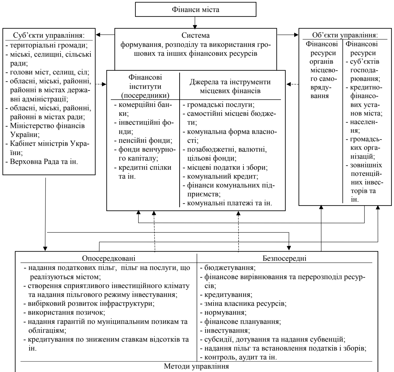
Рис. 2. Основні складові системи управління фінансами міста

Місцеві фінанси виконують функції інструмента перерозподілу ВВП, фінансування суспільних послуг, економічного зростання та фіскального інструмента. Наприклад, як інструмент економічного зростання, місцеві фінанси за допомогою капітальних витрат та діяльності на ринках позичкового капіталу, нерухомості, під управлінням органів місцевої влади та узгоджуючись з органами центральної влади, повинні створювати умови для загального економічного зростання.