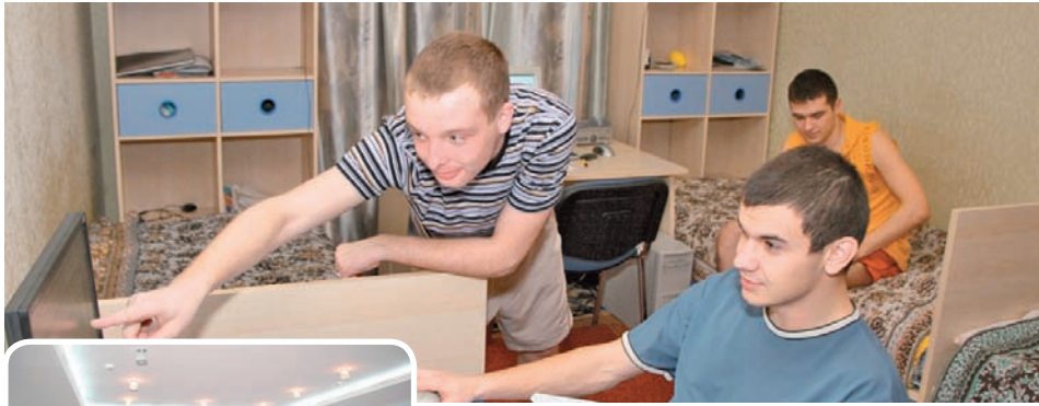
Звичайна кімната гуртожитку