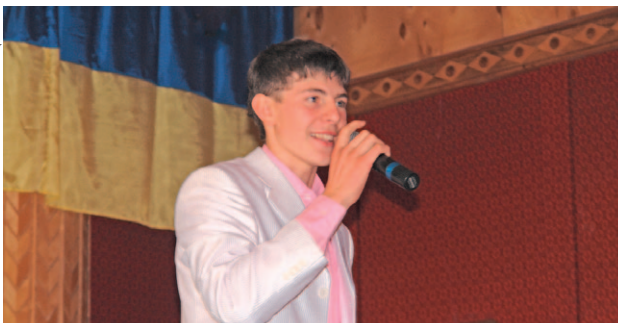
Фото Віталія Яшенка

Коли поруч є творча людина – це не випадково. Вона створює особливу атмосферу навколо всіх і якоюсь мірою робить життя різноманітнішим, наповнює його яскравими барвами. Віталій народився у Краснопілсьькому районі, навчався у Великобрицькій школі. З шостого класу відвідував Сумську народну студію естрадної пісні «Зоряний шанс». За плечима у юного співака – чимало перемог у престиж-