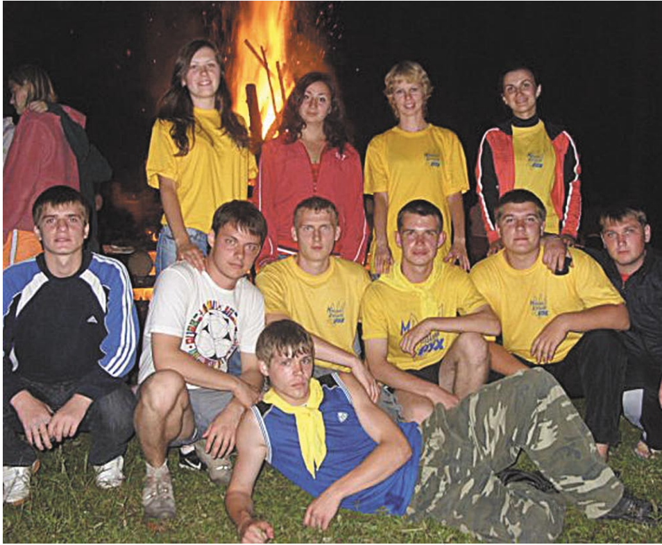
Біля загальної ватри: яскраво і тепло!

ОСОБЛИВО ПРИЄМНО ПИСАТИ ПРО ЦЕ НАПЕРЕДОДНІ ПРОФЕСІЙНОГО СВЯТА – ДНЯ ЮРИСТА, АДЖЕ ЦЬОГО ЛІТА НАШІ СТУДЕНТИ ДОВЕЛИ, ЩО ВОНИ СИЛЬНІ НЕ ЛИШЕ В АУДИТОРІЯХ