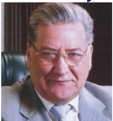
Дорогі студенти, шановні колеги, друзі!

З повагою, Голова Національного банку України В.С. Стельмах