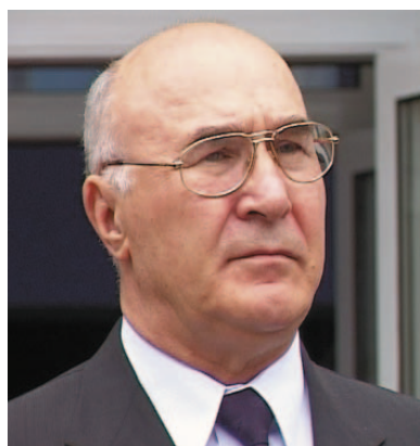
Щиро вітаю весь колектив Української академії банківської справи Національного банку України з ювілеєм!

Приємно відзначити, що за 10 років вуз відбувся, став відомим в усій Україні як кузня кадрів високого гатунку. Випускники академії – економісти, фінансисти, банкіри, фахівці з економічної кібернетики, юристи впевнено розпочинають свою трудову діяльність, надійно продовжують справу зміцнення вітчизняної економіки, розбудови нашої України, перетворення її у високорозвинену європейську державу.