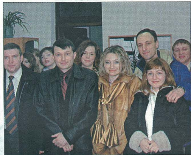
Цифри і факти, зібрані асоціацією випускників УАБС НБУ