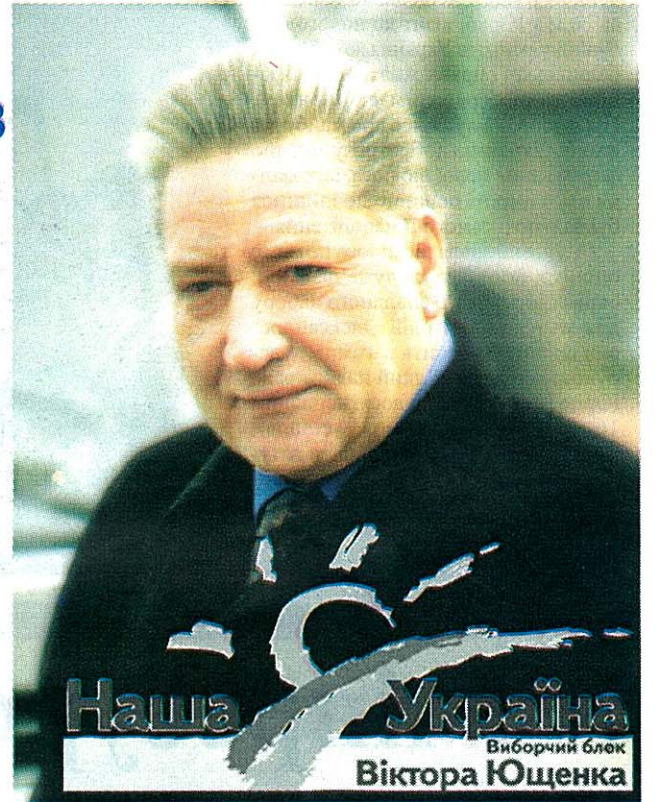
Наша Україна Вибірчий блок Віктора Ющенка

• створити ефективну систему цільової адресної державної допомоги та надавати її тим, хто справді цього потребує; • розробити фінансово обґрунтовану програму захисту підростаючого покоління від насильства, алкоголізму та наркоманії; • підвищити соціальний статус і заробітну плату працівників освіти, науки та охорони здоров'я; • приділяти особливу увагу прикордонному співробітництву регіонів України та Росії, створенню спільної економічної зони.