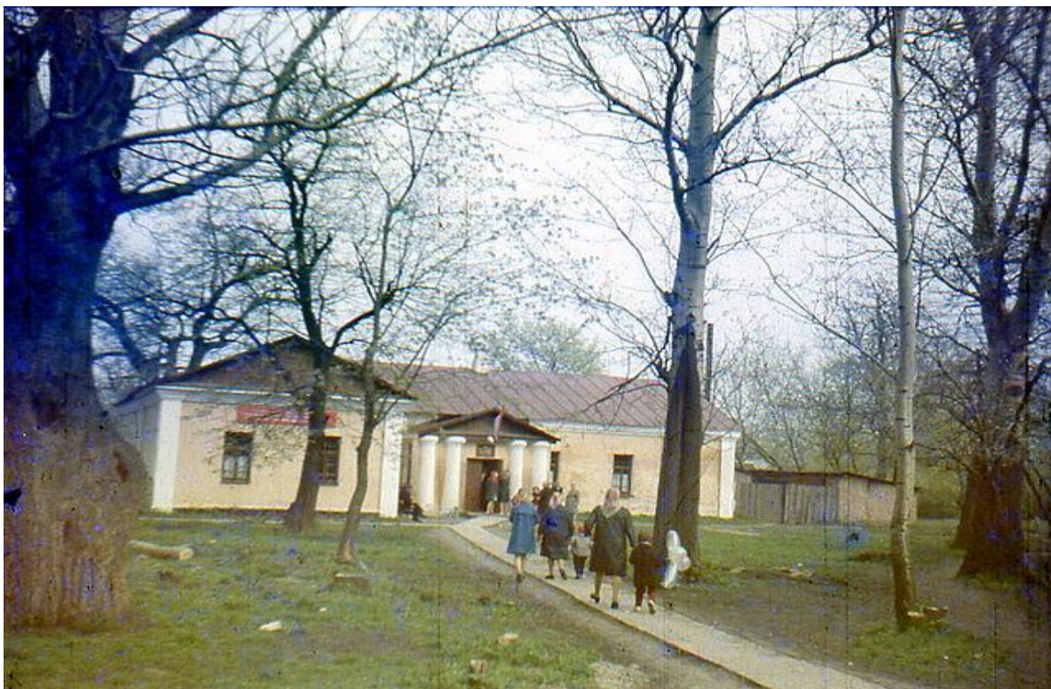
Приміщення банку. 70-ті роки.