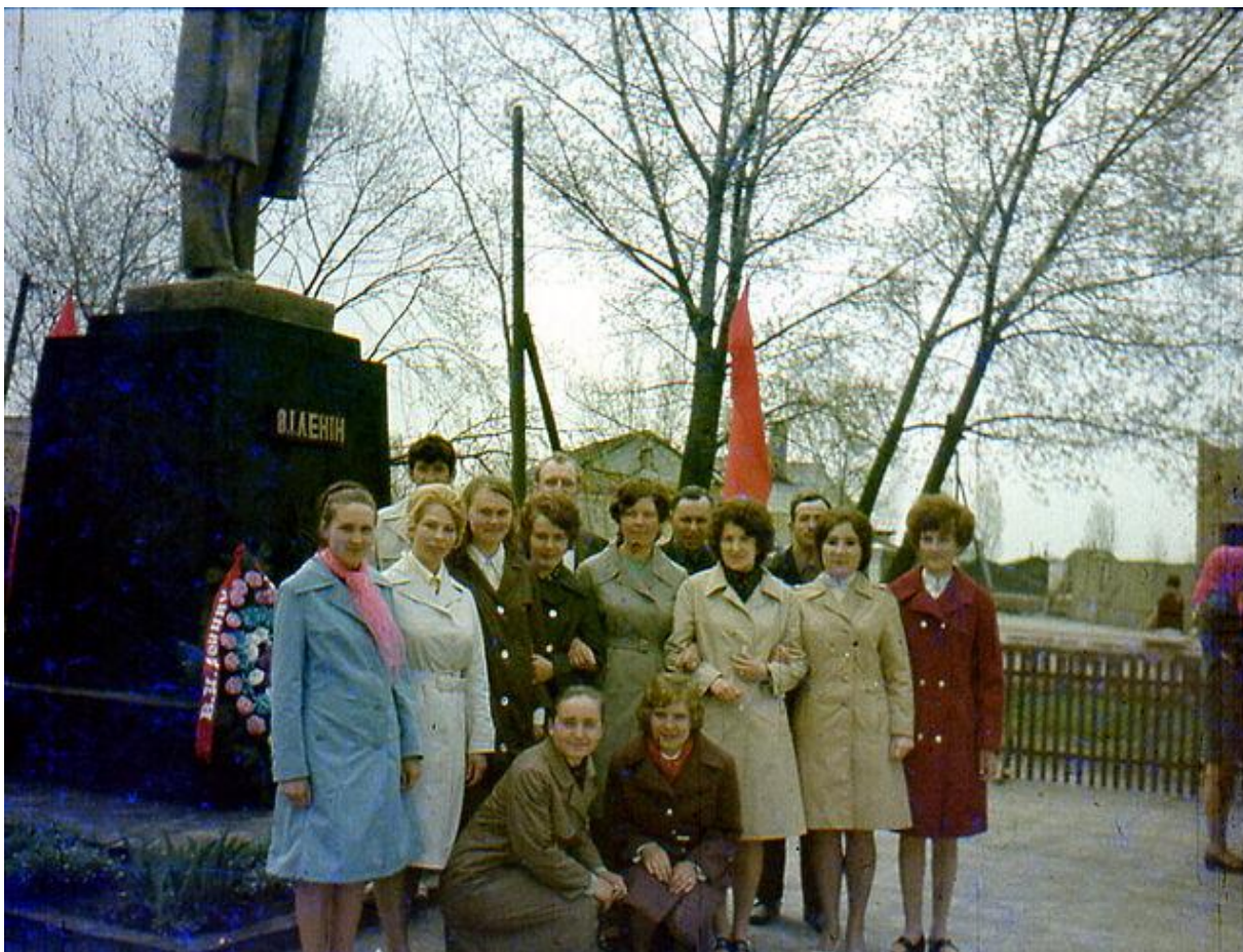
Працівники банку біля пам'ятника В.І. Леніну під час святкування Першого травня. 1970 р.