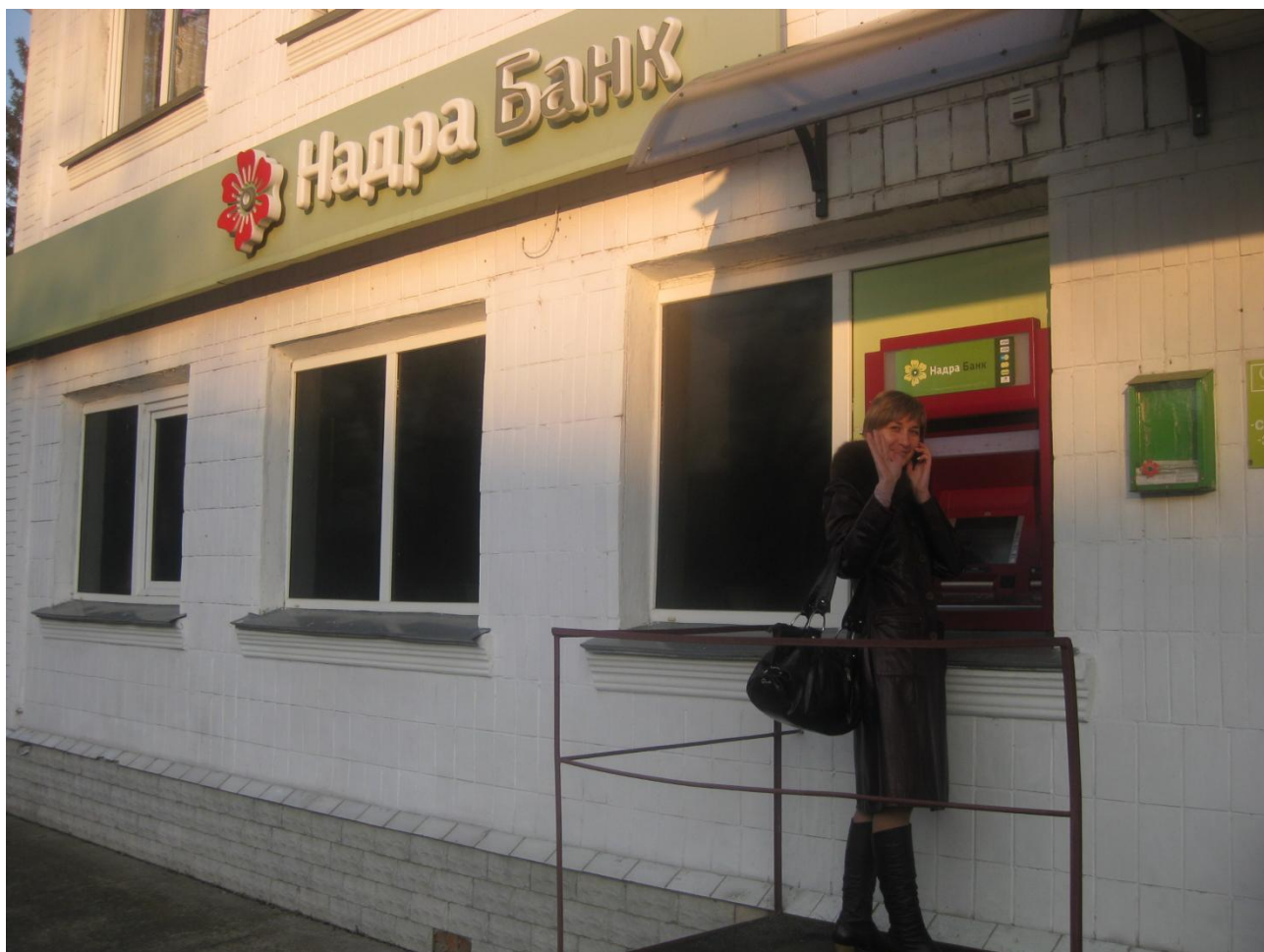
Відділення № 8 Філії ВАТ "КБ "Надра" Сумського РУ "Слобожанщина"