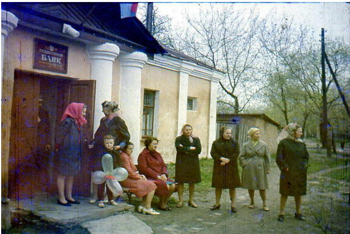
Працівники банку. 70-ті роки.