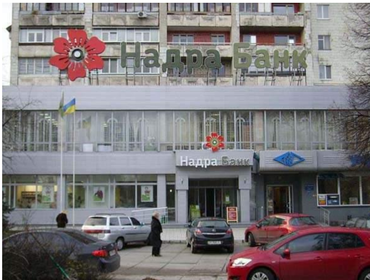
Сумське регіональне управління «Надра Банк»