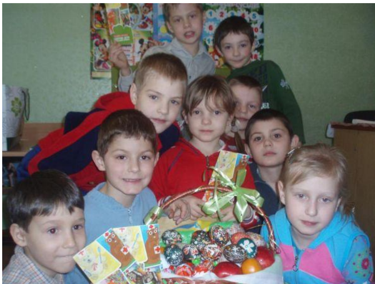
Учасники акції «Розмалюй писанку»