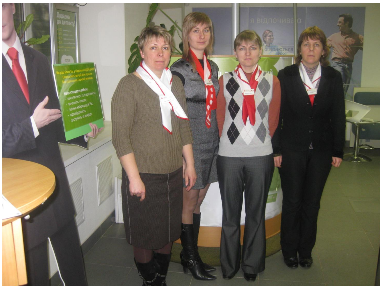
Колектив Буринського відділення «Надра Банк»