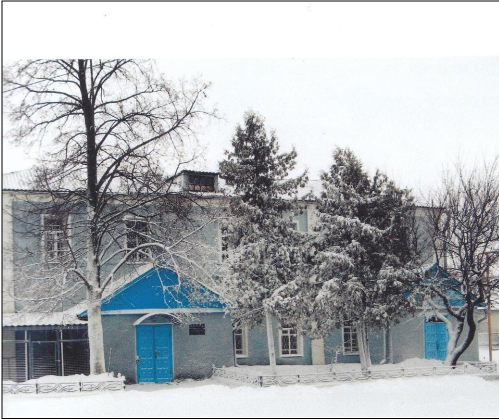
Приміщення, де знаходився Ощадбанк до 1990 року