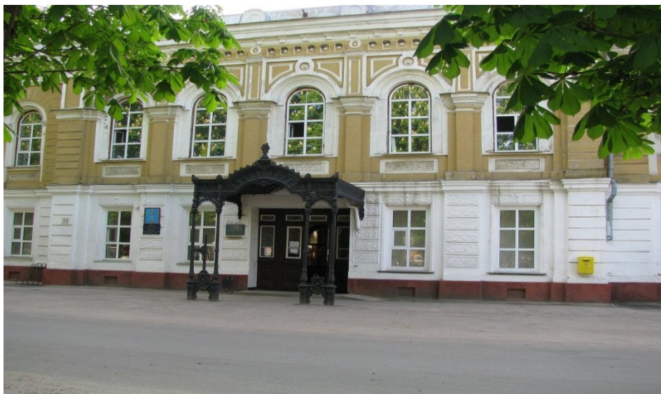
Приміщення Путивльської міської Ради