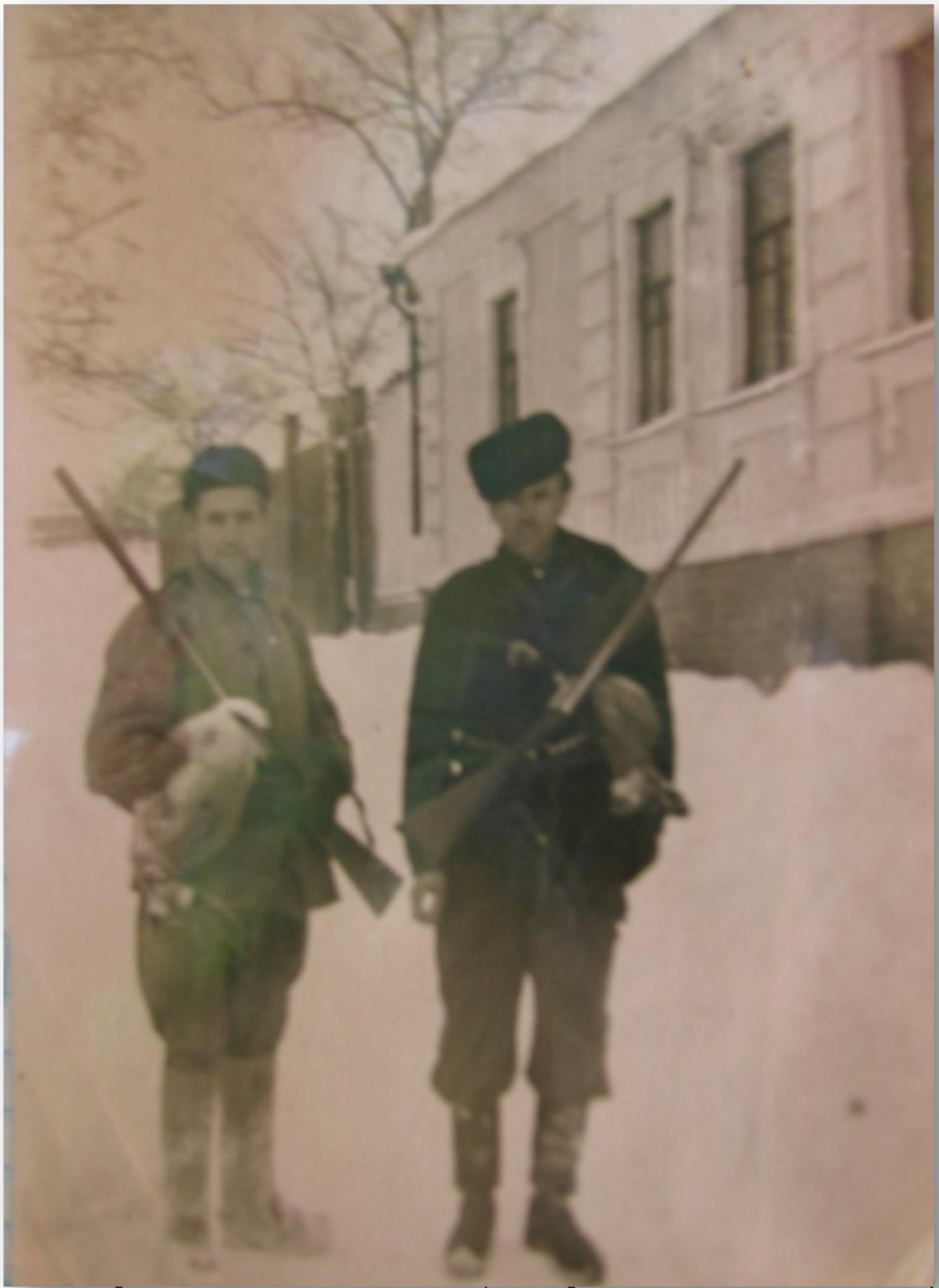
що були в обиході банку