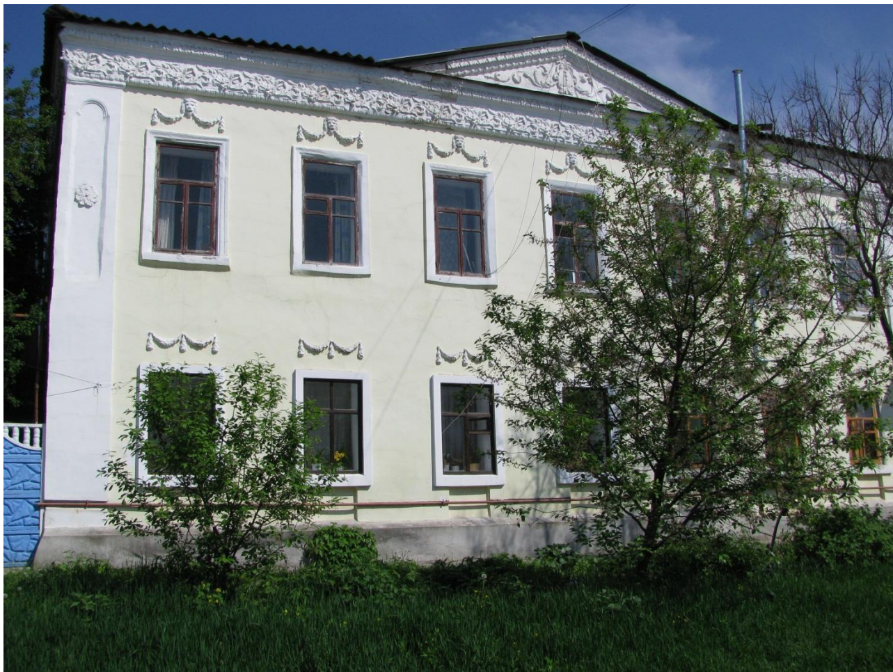
Будинок А.Я. Ефремова.