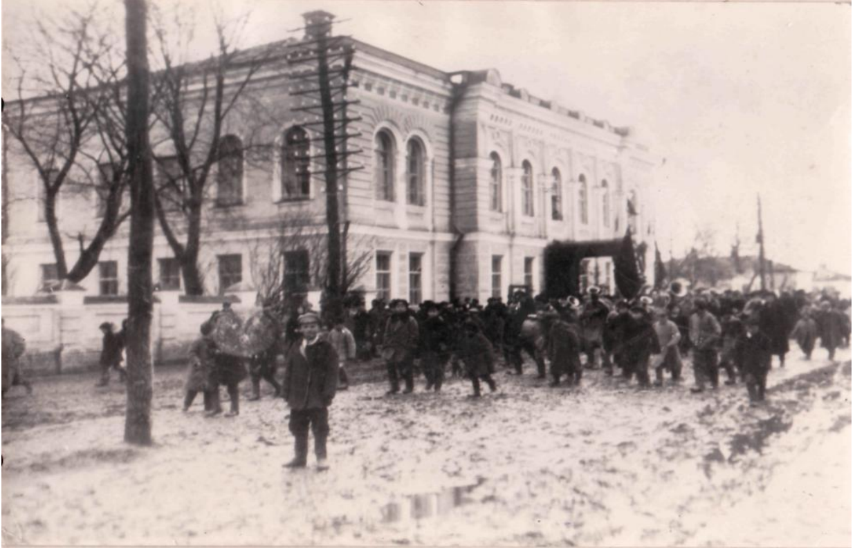
Приміщення Міської Думи при якому працювала Земська Ощадна каса до 1917 року

1 червня 1895 року вийшов закон про організацію дрібного кредиту, який був доповнений в 1904 р. і в 1910 р. Він розширив коло діяльності позичково-ощадних кас, продовжив строки кредиту, ввів заставні операції. Закон створив правову базу для організації нових установ дрібного кредиту-кредитних товариств. На території повітового міста існувала Земська Ощадна каса.