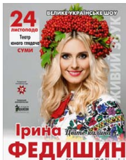
Ірина Федішин 24 листопада, 19:00 Театр Щепкіна