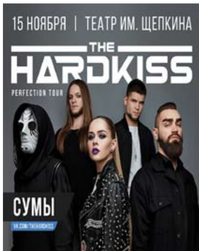
The Hardkiss 15 листопада, 19:00. Сумський театр ім. М.С. Щепкіна