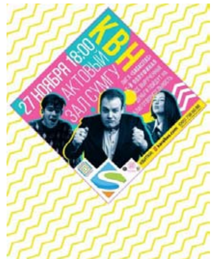
КВН 27 листопада, 18:00 Актова зала СумДУ