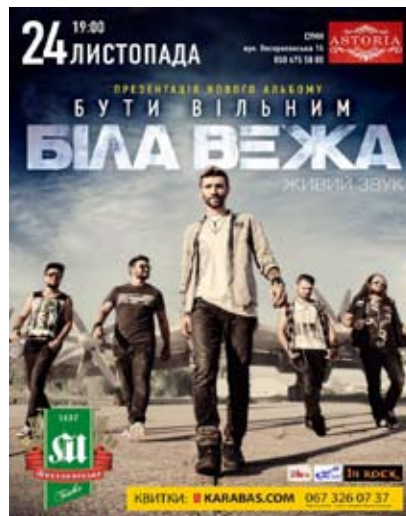
Біла Вежа 24 листопада, 19:00 НК «Асторія»