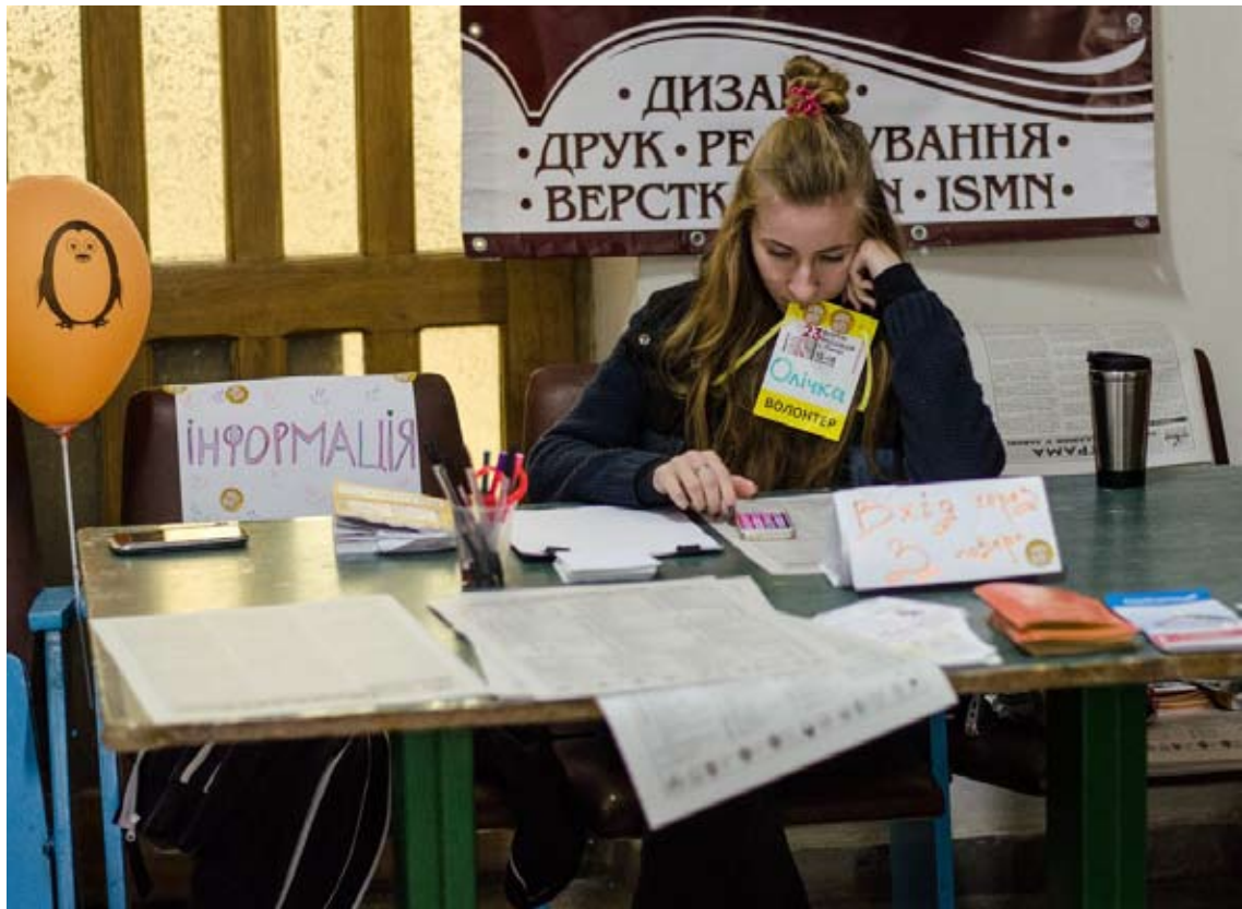
Робота волонтера складна і відповідальна!

Графік роботи передбачав повну віддачу з 9 ранку до 8 вечора протягом чотирьох днів. Колосальний досвід участі в самій організації, отримання навичок роботи з людьми, швидкого вирішення завдань, звісно, були вагомою причиною стати