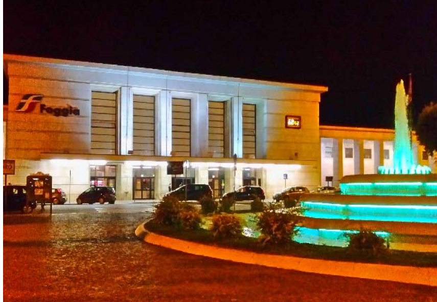
Залізнична станція м. Фоджа