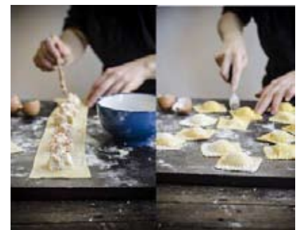
Майстер-клас з приготування равіолі 6 листопада, 11:00. Symbiosi, Харківська, 5