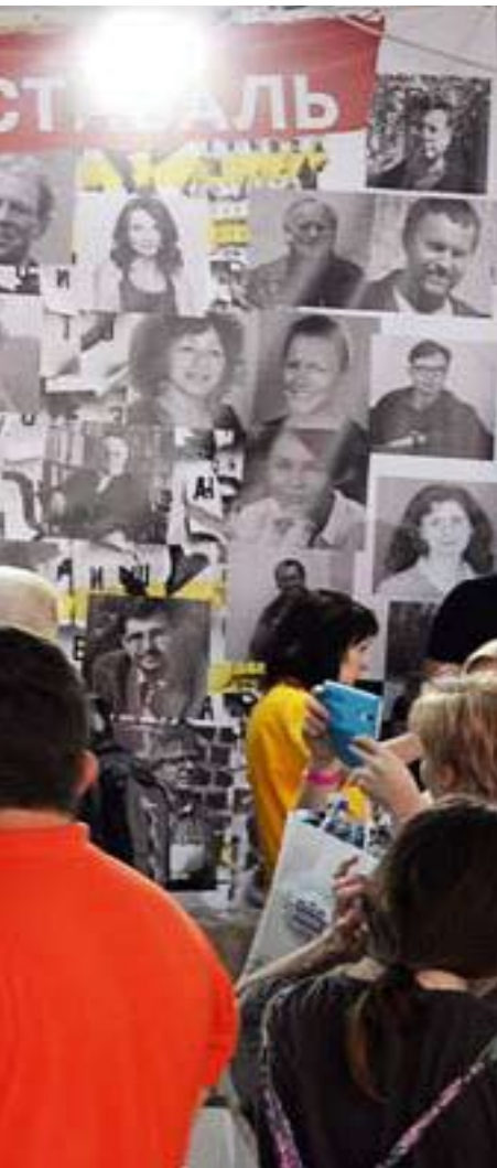
Відвідувачі 23 Форуму видавців у Львові

Фото: прес-служба Форум Видавців Оля Гошко, Гордій Малкович, Олександр Шамов, Данило Решетов.