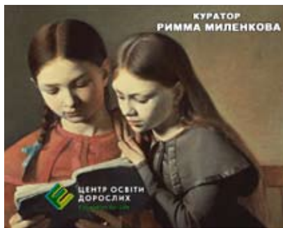
Жива бібліотека: 2 листопада, 17:00. Центр освіти дорослих, Конгрес-хол СумДУ, к. 213