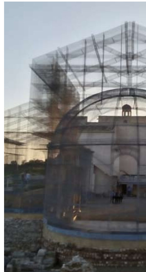
Інсталяція на місці зруйнованого храму курортного містечка Manfredonia

Щ о за земля – Італія! Країна краси, кохання і вічного сонця. Вона покорила Гоголя, Манделу й багатьох-багатьох видатних людей. Скільки разів її завойовували, але ніколи вона не втрачала своєї ідентичності. Іноземці їдуть сюди за відпочинком, натхненням, життєвою наснагою. Італійці ж просто насолоджуються, як здається, безтурботним життям на «європейському чобітку».