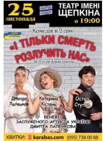
«І тільки смерть розлучить нас» А. Ніколаї 25 листопада, 19:00. Театр Щепкіна