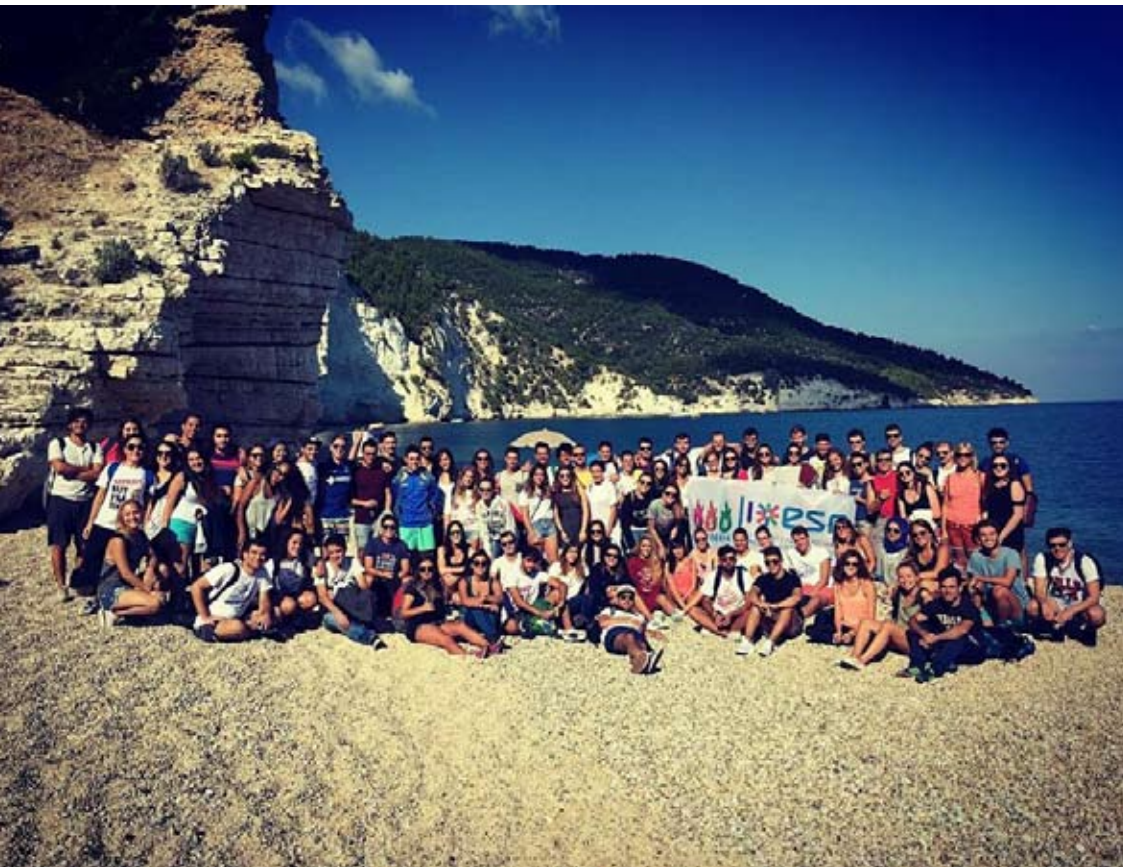
Студенти програми Erasmus 2016