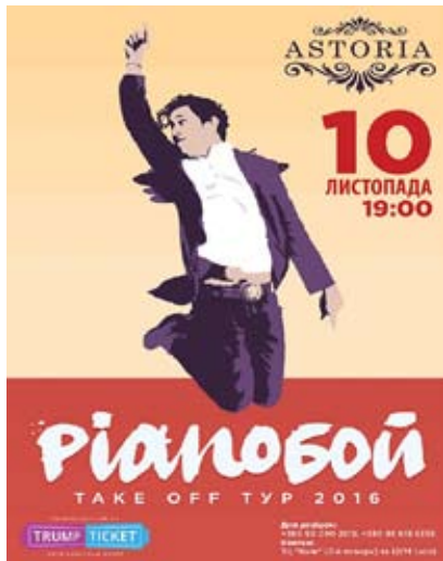
Ріанобой 10 листопада, 19:00. НК «Асторія»