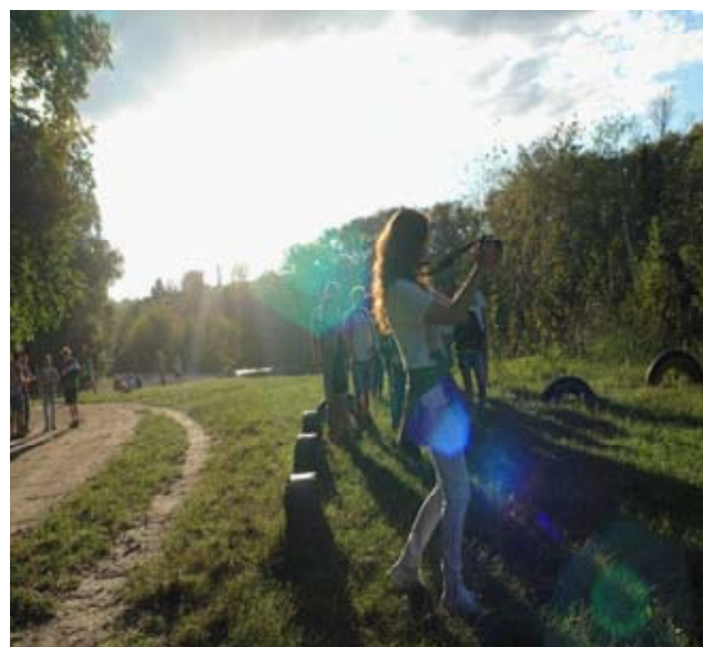
Фотосесія на «Студязі»

Я була готова подолати будь-які перепони, щоб стати частинкою дружньої родини УАБС!