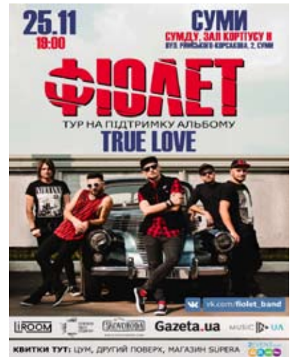
ФІОЛЕТ 25 листопада, 19:00. Актова зала СумДУ