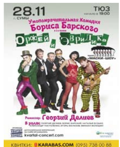
«Маски-шоу» 28 листопада, 19:00 ТЮЗ