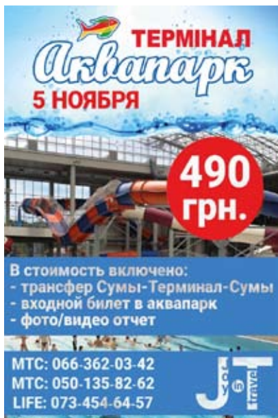
5 листопада 18:00. Термінал Аквапарк, Бровари