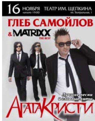
Агата Крісті 16 листопада, 19:00 Театр Щепкіна