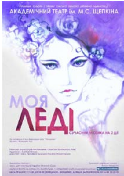
«Моя леді» Б. Шо 5 листопада 18:00. Театр Щепкіна