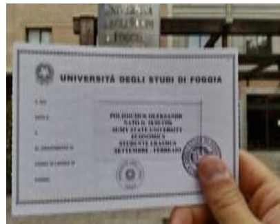
Залікова книжка студентів Erasmus

ри ESN у Фоджі організують дозвілля приїжджих студентів: поїздки, культурні вечори, вечірки, спорт і все, все, все. Завдяки їм ми подорожуємо Італією з гарними знижками.