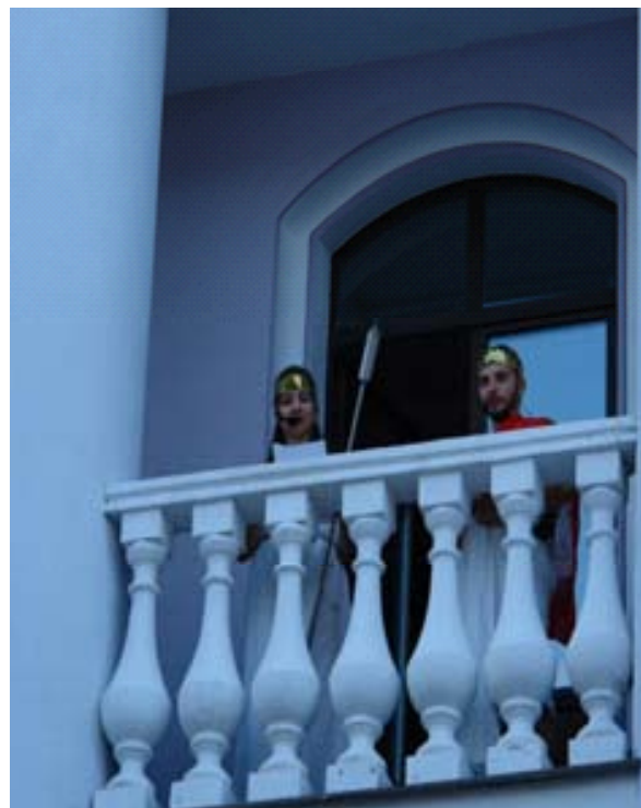
Ведучі в стилі античної епохи