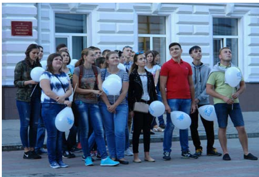
Першокурсники в захваті від посвяти