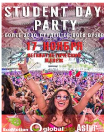
STUDENT DAY PARTY 17 листопада, 19:00 Легкоатлетичний манеж СумДУ